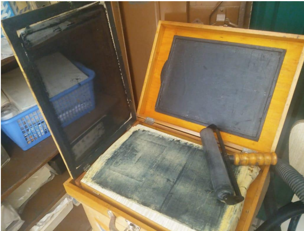
(Mimeógrafo de los años '50 encontrado en el archivo de la cooperativa, era utilizado para realizar varias copias de un documento)